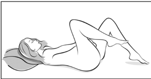
Bild 3 Välj en bekväm ställning för att sätta in ringen